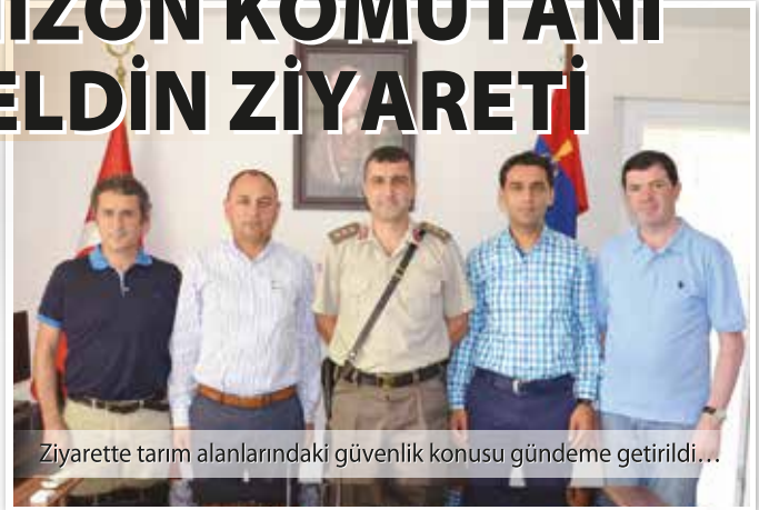
Ziyarette tarım alanlarındaki güvenlik konusu gündeme getirildi...