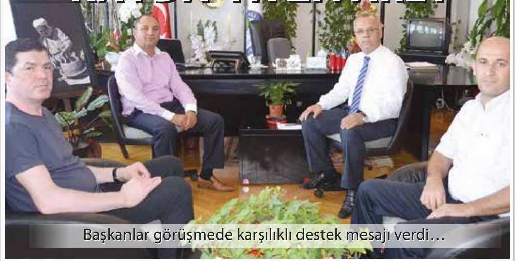
Başkanlar görüşmede karşılıklı destek mesajı verdi...