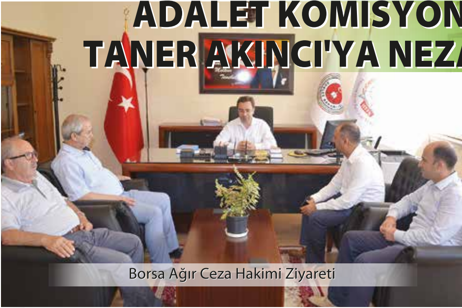
Borsa Ağır Ceza Hakimi Ziyareti