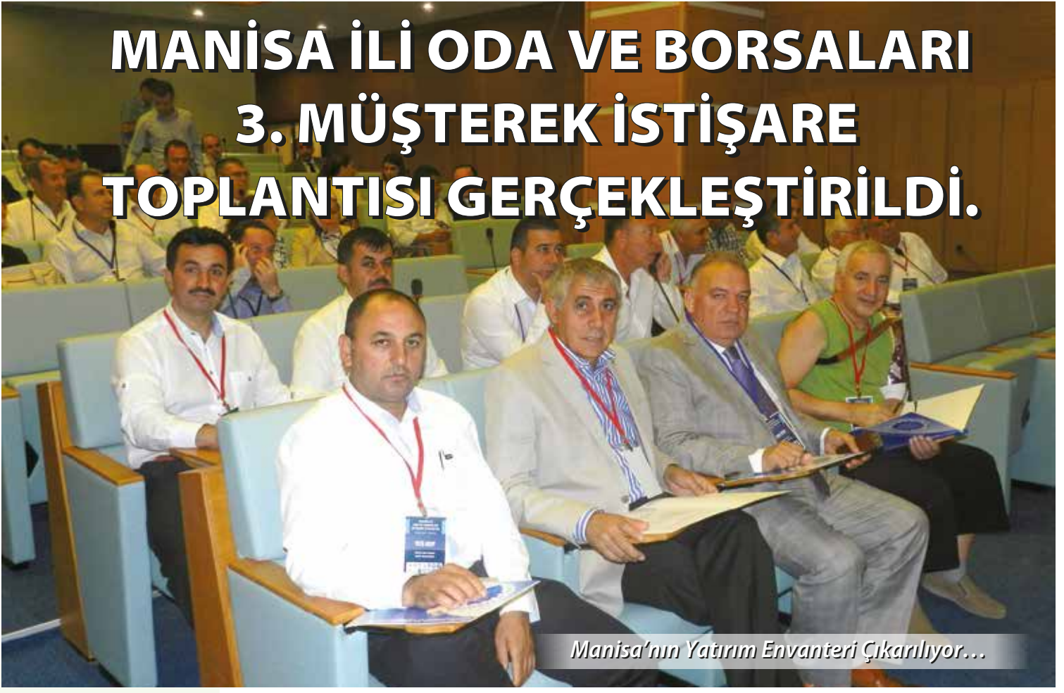
Manisa'nın Yatırım Envanteri Çıkarılıyor...

YAPILAN İSTİŞARE TOPLANTISINA MANİSA İLİNDE BULUNAN ODA VE BORSALARIN MECLİS BAŞKANLARI, YÖNETİM KURULU BAŞKANLARI, YÖNETİM KURULU ÜYELERİ, GENEL SEKRETERLERİ VE TOBB GENÇ GİRİŞİMCİLER ÜYELERİ DE KATILDI.