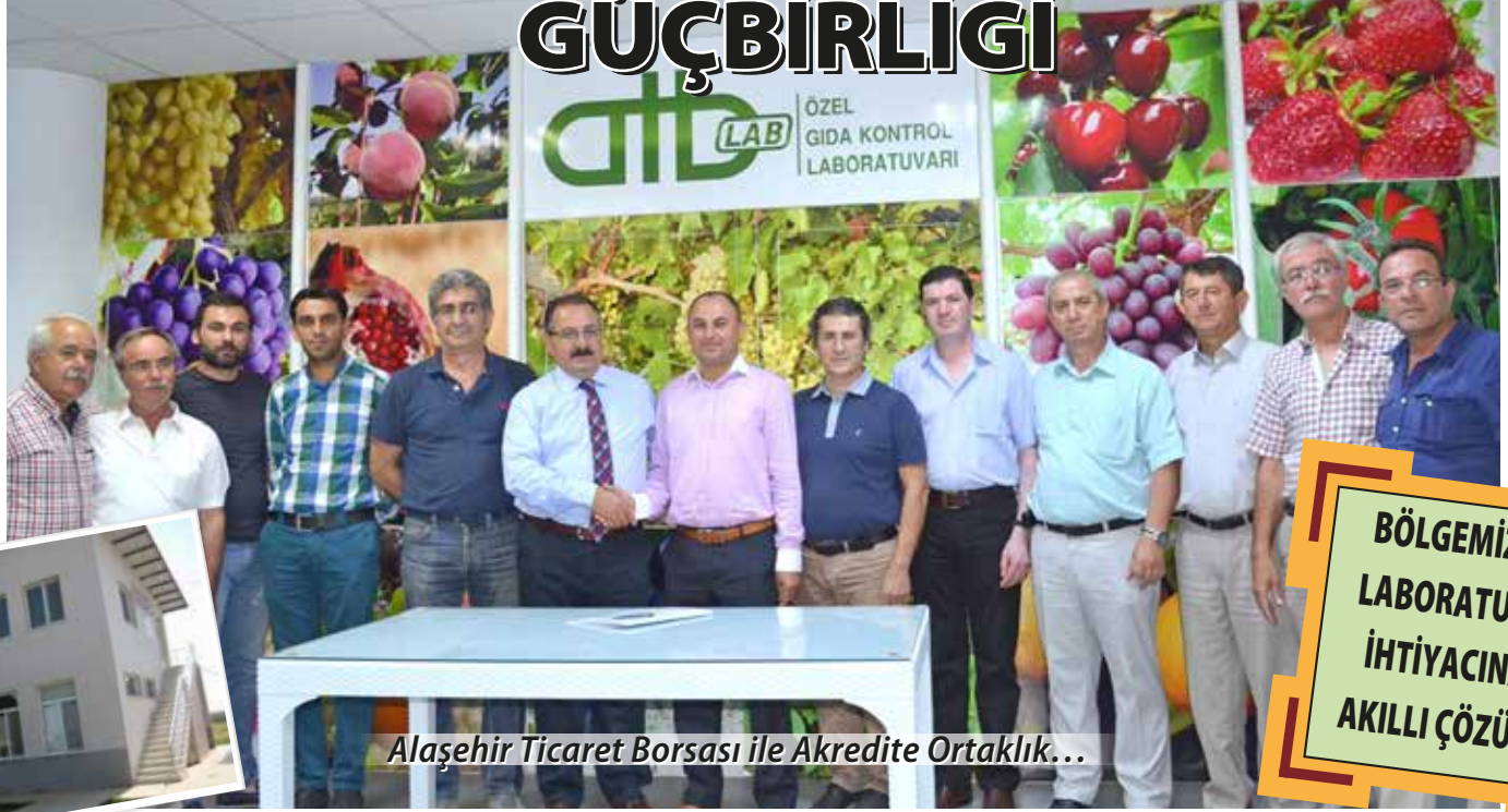
Alaşehir Ticaret Borsası ile Akredite Ortaklık...

BÖLGEMİZİN LABORATUAR İHTİYACINA AKILLI ÇÖZÜM