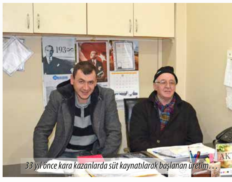
33 yıl önce kara kazanlarda süt kaynatılarak başlanan üretim...