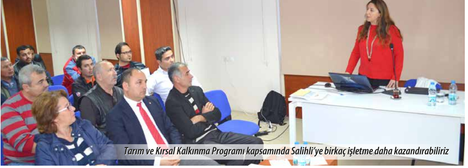
Tarım ve Kırsal Kalkınma Programı kapsamında Salihli'ye birkaç işletme daha kazandırabiliriz