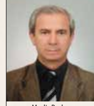
Meclis Başkanı Halil ÇÖYGÜN