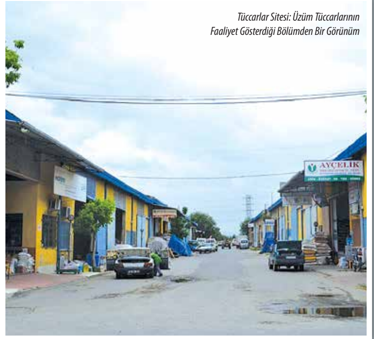
Tüccarlar Sitesi: Üzüm Tüccarlarının Faaliyet Gösterdiği Bölümden Bir Görünüm

Zahireciler Sitesinin Bir Bölümü Tarıma Destek Veren Tüccarlar Tarafından Kullanılmaktadır. Bu Bölümde Çiftçilerimiz Tarım İçin Gerekli Olan Tohum, İlaç vb. Tüm İhtiyaçlarını Karşılatabilecek Malzemeleri Bulabiliyorlar.