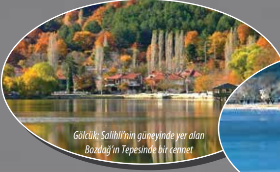
Gölcük: Salihli'nin güneyinde yer alan Bozdağ'ın Tepesinde bir cennet