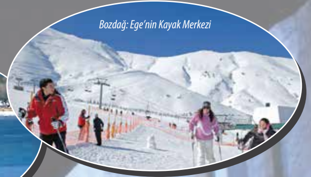
Bozdağ: Ege'nin Kayak Merkezi