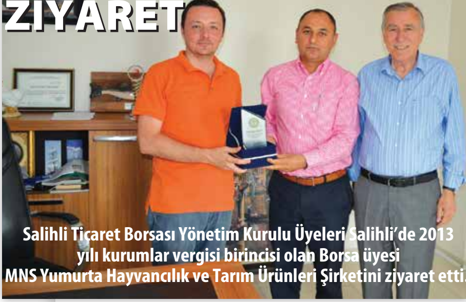
Salihli Ticaret Borsası Yönetim Kurulu Üyeleri Salihli'de 2013 yılı kurumlar vergisi birincisi olan Borsa üyesi MNS Yumurta Hayvancılık ve Tarım Ürünleri Şirketini ziyaret etti.

Aksoy; "Bir şehirde katma değer varsa vergi vardır"