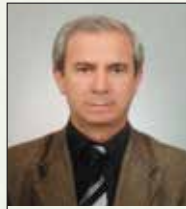
Meclis Başkanı Halil ÇÖYGÜN