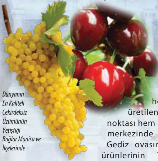
Dünyanın En Kaliteli Çekirdeksiz Üzümünün Yetiştigi Bağlar Manisa ve İlçelerinde