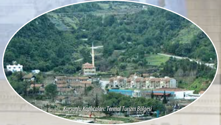
Kurşunlu Kaplıcaları: Termal Turizm Bölgesi

Salihli ticaret ve sanayi geleneği olan bir ilçedir. Salihli Organize Sanayi Bölgesi'nde çoğunluğu gıda firması